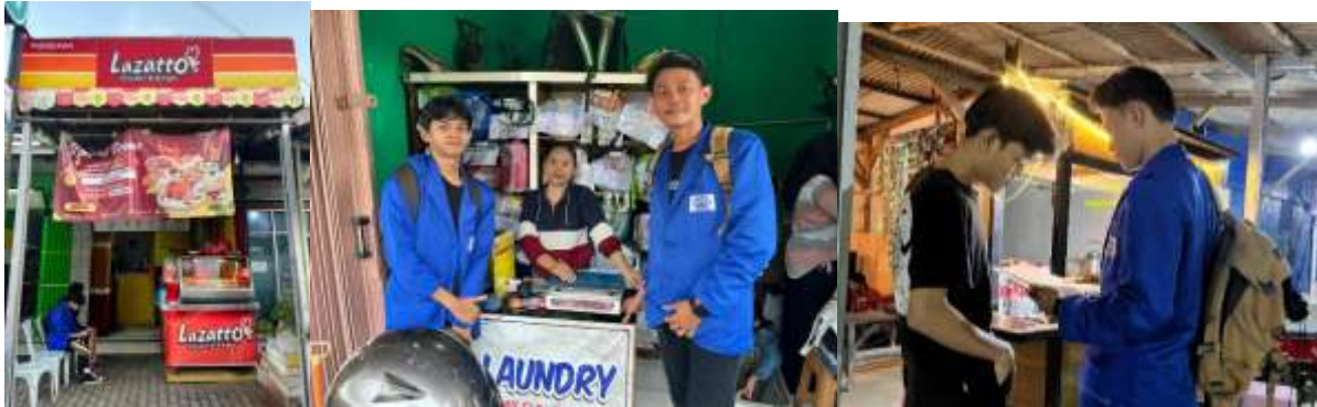
Gambar 2. Proses Wawancara dengan Pelaku Usaha

Tim pendamping melakukan pembekalan mengenai aplikasi keuangan digital, yaitu aplikasi BukuKas, yang dapat diunduh dengan mudah oleh pelaku usaha dengan memberikan pemahaman mengenai fitur-fitur yang terdapat pada aplikasi tersebut.