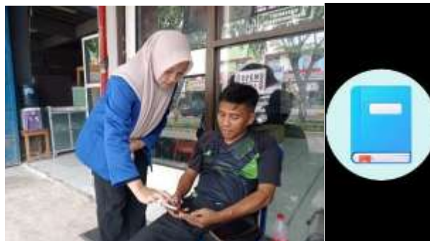
Gambar 3. Proses pendampingan