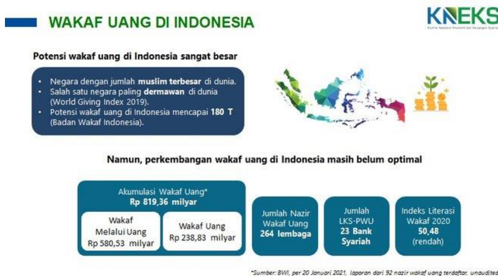
Gambar 1. Potensi Wakaf Uang di Indonesia

Kepala Divisi Pengelolaan dan Pemberdayaan Badan Wakaf Indonesia (BWI), Iwan Agustiawan Fuad mengatakan potensi wakaf bisa menjadi instrumen pembiayaan alternatif yang dapat menunjang pertumbuhan ekonomi masyarakat. Potensi wakaf di Indonesia bisa mencapai Rp. 180 triliun. Tetapi dalam penghimpunannya pada tahun 2017 baru mencapai Rp.400 Miliar dari potensi sebesar Rp. 180 Triliun tersebut (Setiaji, 2017). Sedangkan menurut Imam Rulyawan (Direktur Utama Organisasi Kemanusiaan Dompot Dhuafa), potensi wakaf di Indonesia mencapai Rp 100 Triliun per tahun dengan asumsi 100 juta masyarakat muslim dari kalangan mampu mengalokasikan Rp. 10.000 per bulan (Antara, 2017).