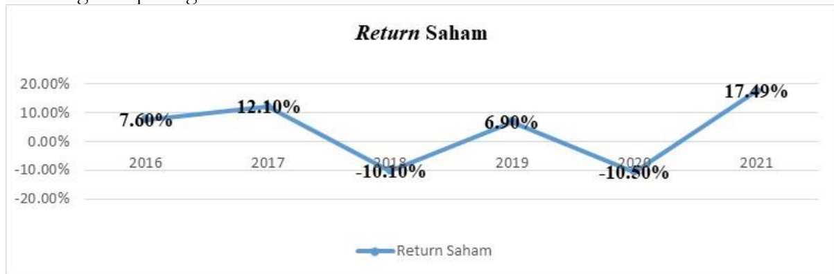
Gambar 1. Fenomena Return Saham Perusahaan Sektor Infrastruktur

Investor sebagai pembeli saham tentunya mengharapkan keuntungan yang besar dari saham perusahaan yang dibelinya. Sebelum memutuskan untuk membeli saham, sebaiknya investor memperhatikan saham perusahaan yang dijual di pasar modal agar saham yang dibelinya dapat memberikan return pasar saham yang diharapkan. Salah satu sektor yang bisa dipertimbangkan untuk menginvestasikan dana para investor adalah sektor infrastruktur. Sektor infrastruktur memegang peranan yang sangat penting dalam pembangunan ekonomi suatu negara. Perusahaan yang beroperasi di sektor ini memiliki tingkat pertumbuhan yang cepat dan potensi keuntungan yang tinggi. Namun, seperti halnya sektor lain, perusahaan infrastruktur juga menghadapi tantangan dan risiko signifikan yang dapat memengaruhi kinerjanya di pasar modal. Fenomena return saham ada perusahaan Sektor Infrastruktur di Bursa Efek Indonesia tahun 2016-2021 dapat dilihat melalui grafik pada gambar 1.